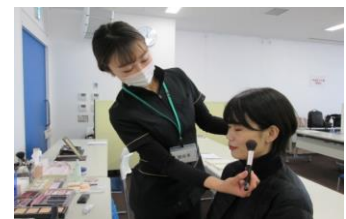
面接用メイク体験