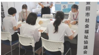
仕事相談ブースの様子