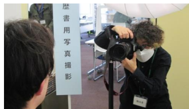
履歴書用写真撮影コーナー