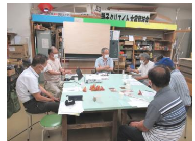
打ち合わせの様子

豊田少年少女発明クラブを卒業した高校生から70代までの男女15名で活動しています。今年で設立30周年となります。