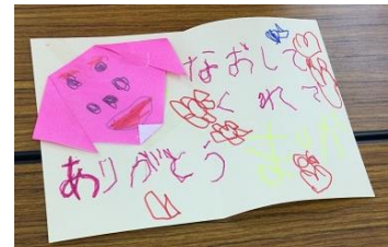
子どもから貰ったお手紙

おもちゃシューリーズでは、一緒に活動してくれる仲間を募集しています。モノづくりが好きな方、子どもが好きな方、大歓迎です！皆さんも、おもちゃ修理のボランティア活動を通じて子どもたちの笑顔に触れてみませんか？