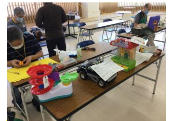
おもちゃ修理の様子