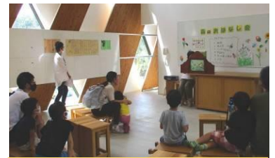
虫たちの知恵にびっくり！ 季節の楽しい紙芝居

子どもたちが、目を輝かせて絵本や紙芝居等の世界を楽しみ、生きものの生き生きとした姿、知恵や工夫に感動している姿を見ることができたとき、幸せな充実感を味わうことができます。そのために、子どもたちの思いや意識の流れを大切に選書、自然とのふれあい体験等を取り入れたプログラムの検討に努めています。