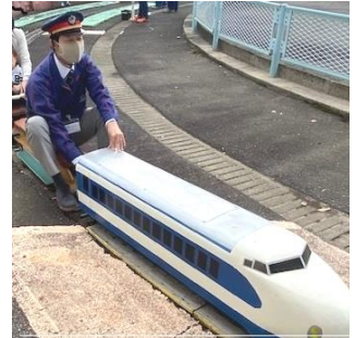
ミニ新幹線運行の様子