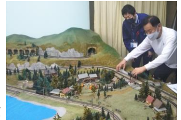
鉄道模型整備の様子

◎ご興味のある方は、本会ボランティアセンターまでご連絡下さい。(問合せ先は4ページに記載)