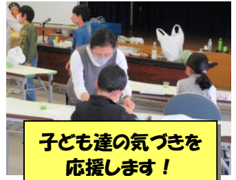
子ども達の気づきを応援します！

活動場所は、高橋交流館の隣にある豊田市こども図書室です。①本の整理や簡単な修理を行う「図書整理係」、②本をたくさん読んだ子どもたちへのプレゼントを作る「お楽しみ係」、③図書室の飾りつけを行う「飾りつけ係」、④機関紙「たまごぴよ」を発行する「機関紙係」と、⑤こども図書室開館時間中(水～日曜日および祝日の10時～16時)に、子どもたちと遊んだり、絵本や紙芝居を読んだりする「曜日係」の5つの係に分かれて活動しています。また、本を使って子どもたちが楽しく学ぶイベントを開催しています。