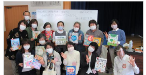
3月27日開催のイベント「夢まつり」に参加したボランティアと先生で集合！