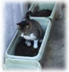
(上写真) 屋外に設置したトイレで用を足す姿。

飼い主のいない猫を放置せず地域で意見交換をして出来るだけ多くの合意を得ながら見守り管理する活動です。