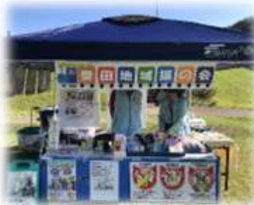
(左写真) 動物愛護活動イベントで自活動のPRもします。