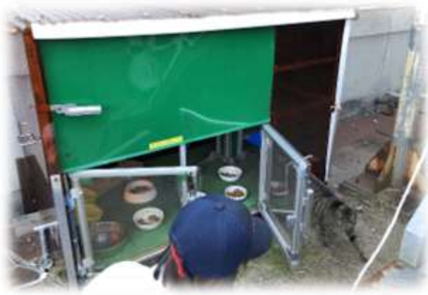
トヨタ自動車(株)工場内に設置されている「猫ハウス」です。ここには13匹の地域猫が餌を食べ寝泊まりしています。

地域猫活動の普及と定着支援をしています。具体的には各種イベントでの地域猫活動のPRや地域猫の不妊手術と給餌(きゅうじ)やトイレの管理に取り組む住民ボランティアに対するアドバイスなどを行っています。