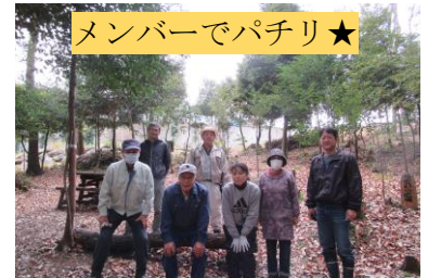
メンバーでパチリ★

浄水北小学校が平成26年4月に設立される以前に、市学校づくり推進課が地域住民に呼びかけて「どんな学校にしていきたいか」というテーマでワークショップを実施しました。そのときに隣接する森林等をどうしていこうかという話し合いを重ね、せっかくなので活かして、子どもたちが勉学だけでなく様々な体験ができたり、地域住民も利用できるようにしていこうと、有志で立ち上がりました。わくわく事業を活用して活動しています。