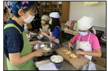
子ども食堂の様子

本会では、子ども食堂の支援を行っており、様々な相談にも対応しています。その一つが企業や個人の方から子ども食堂へ物品寄付です。ご寄付いただいた食材などは、子ども食堂で活用しています。