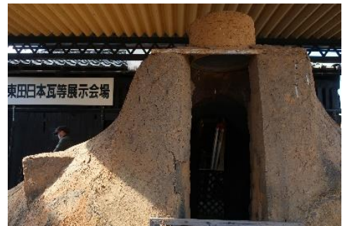
↑ 瓦焼成のための達磨窯は、大正時代に造られました。当時の形態を今も留めています。