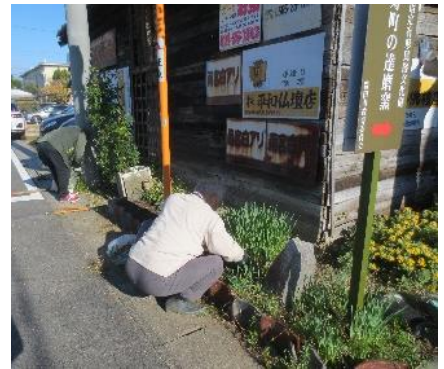
↑ 環境整備に励むスタッフの皆さんです。達磨窯を訪れるお客様を整備された季節の花でお迎えします。

「愛・Eyeウォーク」の志に賛同し、共に活動していただけるメンバーを募集しています。東田自治区民以外の方も参加いただけますので、まずは一度見学に来てください。